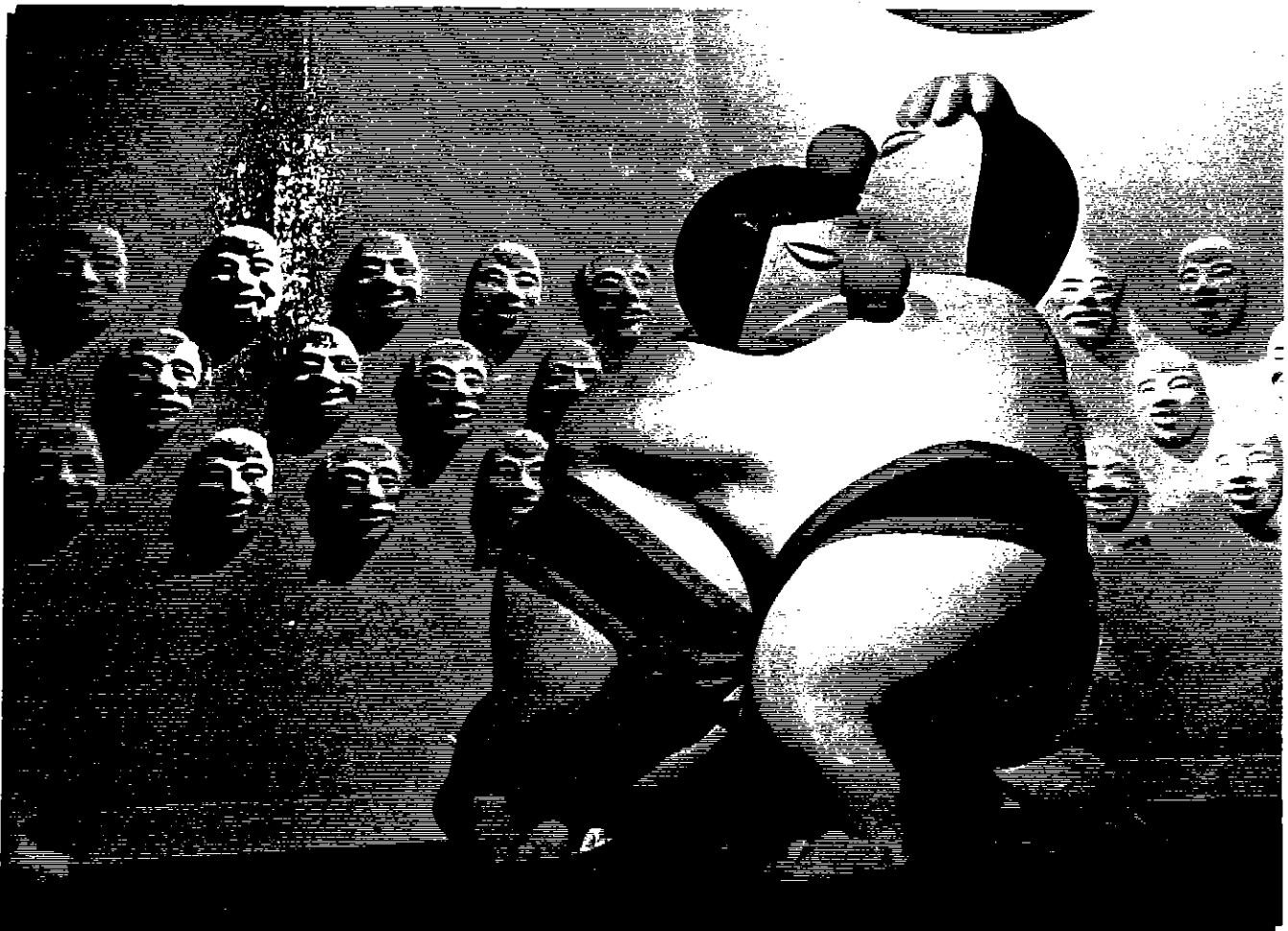
de Japanse Worstelaars.

Onze wereldreis in het Carnaval Festival zit er op.