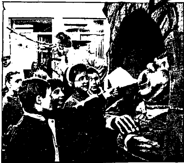
Ook de echte holle bolle Gijs is aanwezig. Gretig slokt hij alle papertjes op.

Steeds meer komen Efteling-fans in de belangstelling. Niet alleen door de pers en andere media, maar ook doordat ze allerlei activiteiten organiseren over of met Efteling. Twee verhalen van actieve Efteling-fans vind je hieronder. Heb je zelf ook een artikel of verslag voor het EFC kun je dat altijd opsturen. Wil je iets gaan organiseren kun je altijd met ons contact op nemen voor informatie, medewerking of wat dan ook.